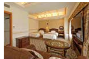
スイートベッドルーム