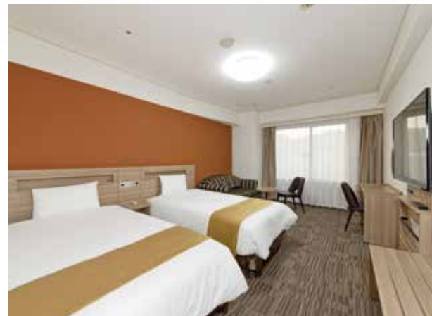
スーベリアツインルーム (一例)

英国王室御用達のスランパーランド社の32cm厚ベッドマットレスに 加えて、加湿機能付空気清浄機、50型4Kテレビ(YouTube無料視聴可能)、 リモコンで調光可能な天井照明と快適機能を備えた客室。 ユニバーサルルーム、ファミリールーム、レディースルームもご用意して います。また全客室、Wi-Fi接続サービス対応に加え、有線LANもご利用 可能で、コンセントも増設し、ビジネスサポート機能も整えました。