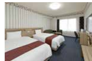
レディーススーベリアツインルーム (一例)