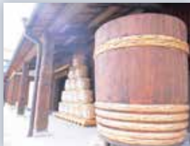
ハーバーランド・モザイク 灘・酒蔵