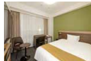
シングルルーム (一例)