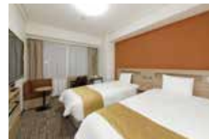
スタンダードツインルーム (一例)