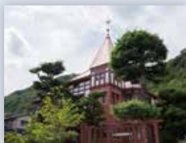
神戸北野異人館風見鶏の館